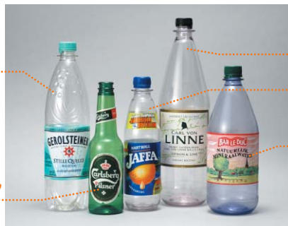
色々な国のペットボトル(洗って繰り返し使うタイプ)