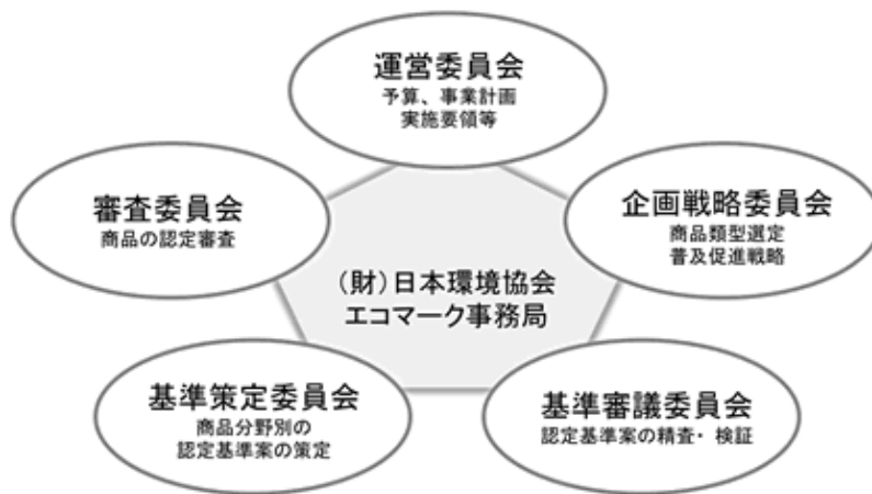
図. エコマーク事業の運営体制