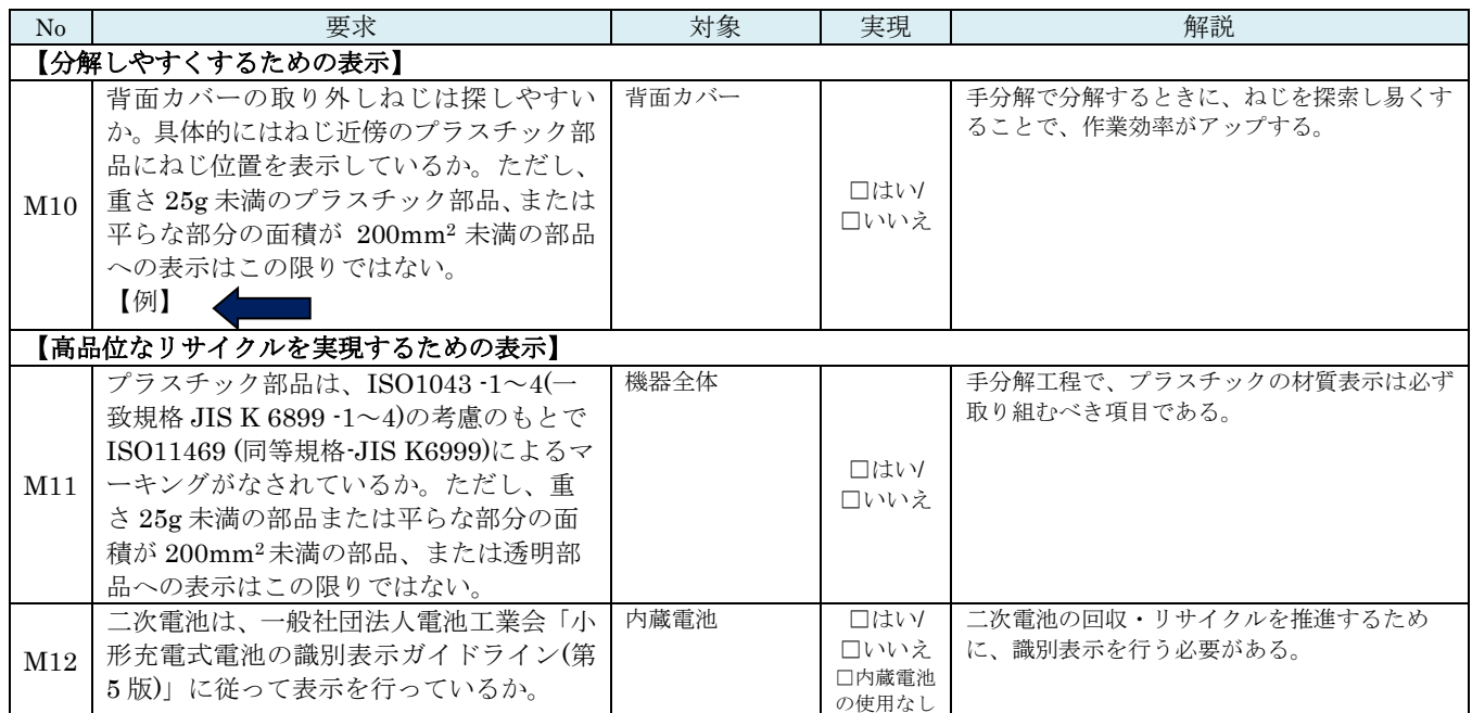
別表1 製品設計チェックリスト (3/4)