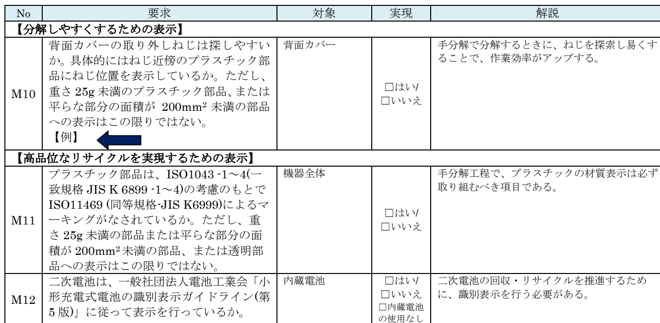
別表1 製品設計チェックリスト (3/4)