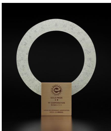
エコマークアワードトロフィ (イメージ)